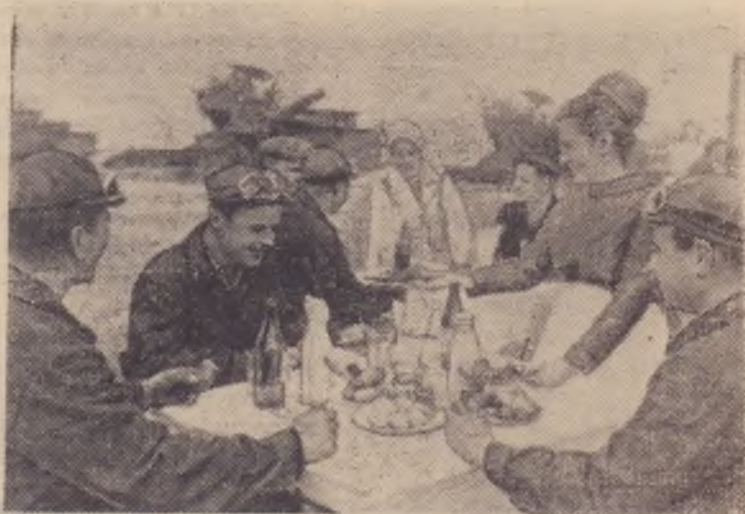
ЖИТОМИРСКАЯ ОБЛАСТЬ. Ружинский райпотребсоюз хорошо организовал питание механизаторов в поле.

Исполком райсовета принял решение, направленное на улучшение подготовки школ к новому учебному году. В частности, исполком обязал зав. роно тов. Румянцева в ближайшее время рассмотреть вопрос о готовности к новому учебному году на совещании руководителей школ на заседаниях педагогических коллективов. На исполкомах и сессиях Советов принять конкретные меры по образцовой подготовке каждой школы. При этом обратить особое внимание на качественный ремонт каждого здания, на приобретение необходимого учебного жесткого и мягкого оборудования, на организацию горячего питания, на завоз школьных и спортивных форм, одежды и обуви для детей школьного возраста, на выполнение закона о всеобщем обязательном восьмилетнем образовании.