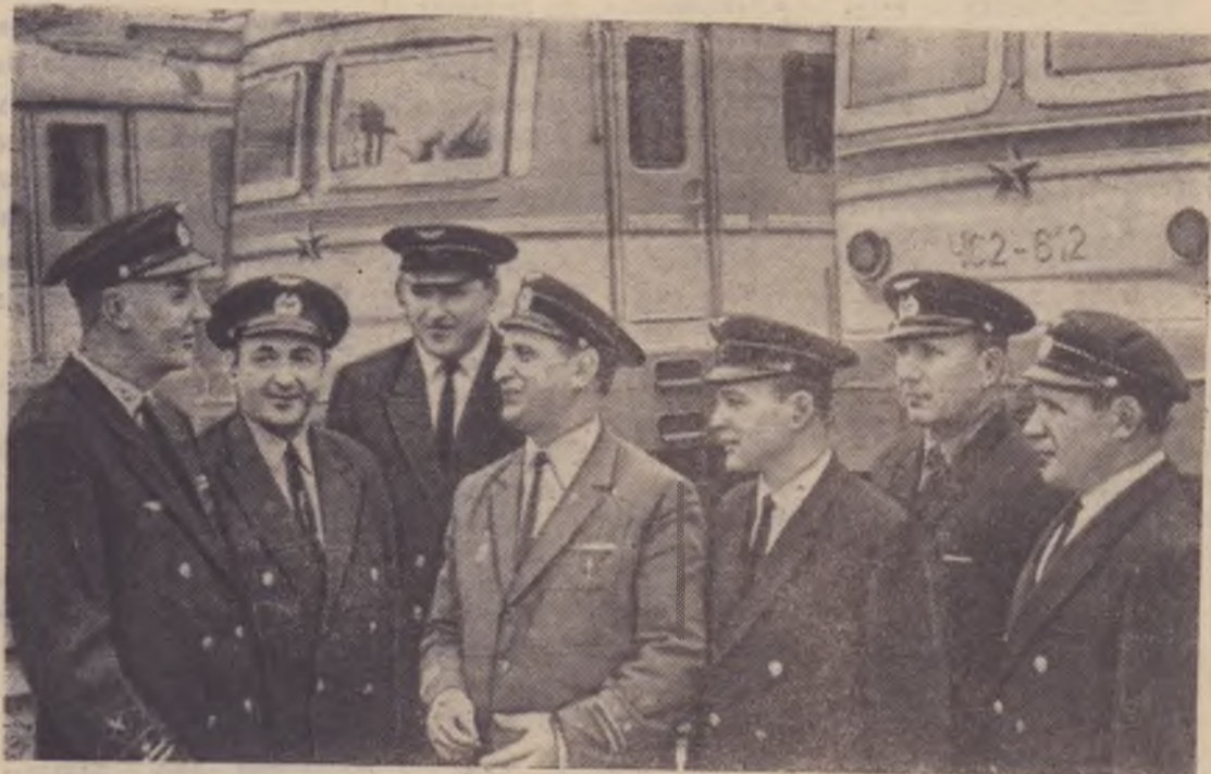
Рейд народных контролеров

Торжественная встреча — осмотр корабля-музея начинается в 9 часов утра.