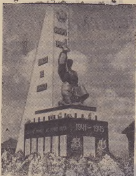
Бронзой на солнце Свернают слова: «Ничто не забыто», «Никто не забыт». Вечная память В народе жива О них, воплощенных В гранит. На снимке: памятник погибшим воинам в с. Поздняково.

А. ДАВИДОВ, тренер боксерной секции ДСО «Труд».