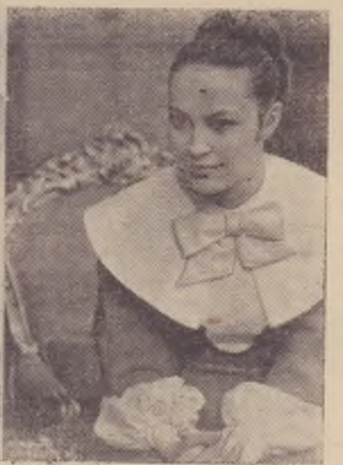
На киностудии «Мосфильм» режиссер А. Роом снимает свой новый фильм «Цветы издалека». Сценарий А. Роома по одноименному рассказу А. П. Чехова.