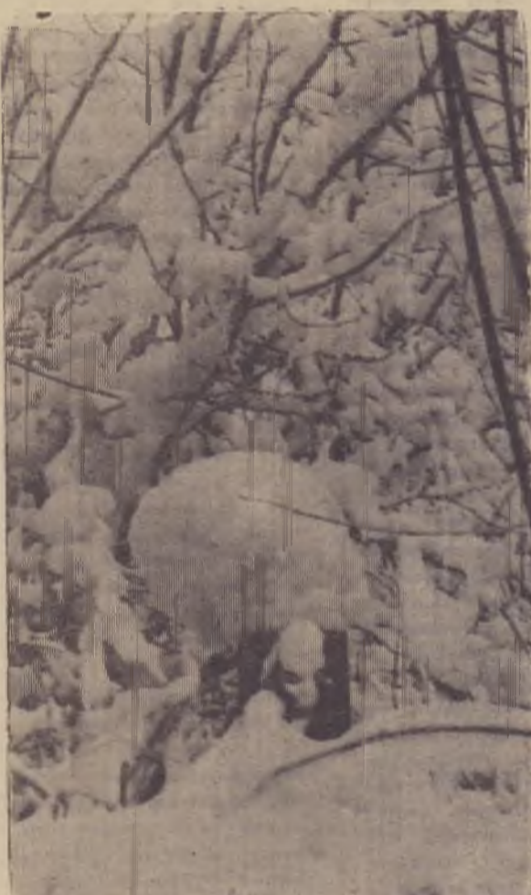
ДО БОЛИ МИЛЫЕ ПРОСТОРЫ! ПРИТИХШИЙ ЛЕС МОРОЗ СКОВАЛ. ЗИМА НАТКАЛА ЗДЕСЬ УЗОРЫ, СПЛЕЛА В ПРИРОДЕ КРУЖЕВА.