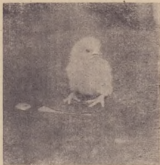
Вступление в жизнь.