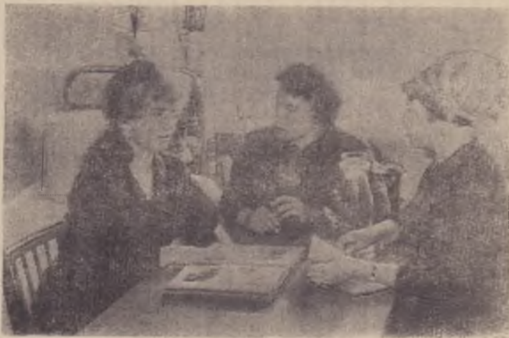
Снимок № 5

Проходим дальше. Мой гид объясняет: все комнаты с нечетными номерами трехместные, а противоположные — четырех. Идем мимо кухни-кубовой, вдоль длинного ряда комнат. В середине этажа — просторная комната с застекленными дверями. Заглядываем внутрь: прежде всего в глаза бросается телевизор марки «Аврора».