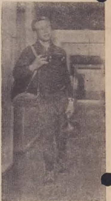
Снимок № 6

—К бытовым удобствам общежития, — добавляет комендант, — относится и то, что на каждом этаже имеется кухня-кубовая, оснащенная установкой для горячей воды, плитой и холодильником. На каждом этаже туалеты, умывальные. Новому дому — новый быт. С введением пропускной системы заметно улучшится дисциплина в общежитии, посторонние могут войти в общежитие, только по предъявлению у-