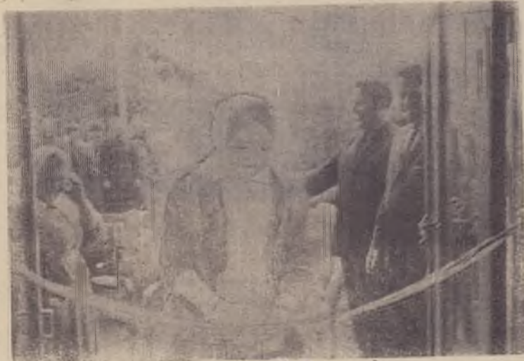
Снимок № 3