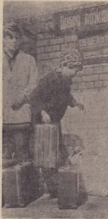
Снимок № 4

рый барак на Коммунистической, оставлено тесное общежитие на улице Калинина. Новое общежитие! Здесь всем хватит места, ведь в 148 комнатах со всеми удоб-