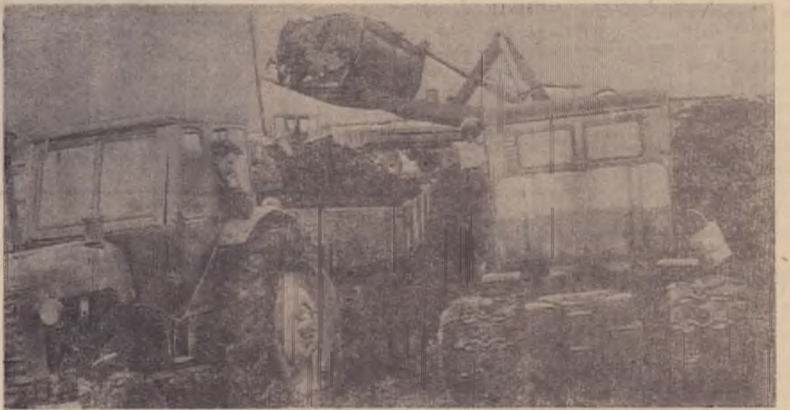
Взятым обязательствам — досрочное выполнение

А. ЕВСТАФЬЕВ, агроном районного управления сельского хозяйства. На снимке: вывозка торфа в Угольновском колхозе.