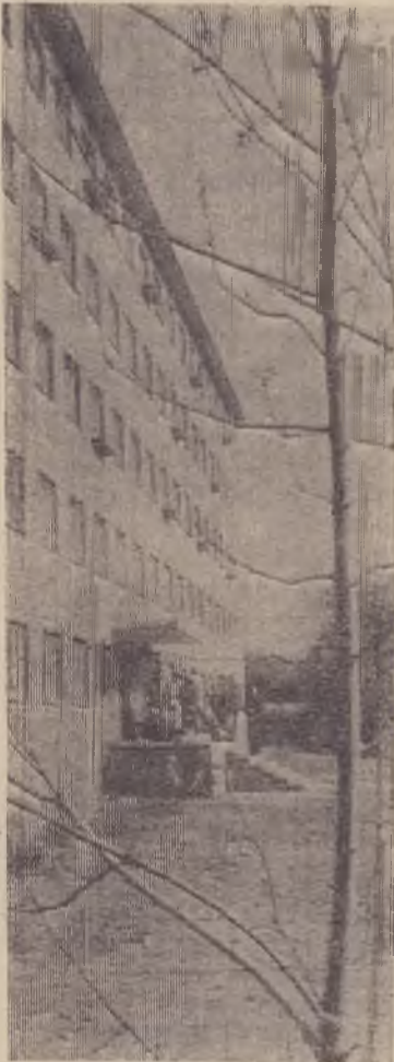
Снимок № 2

Планы на будущее? Мы прежде всего будем заботиться о культурном отдыхе молодых рабочих: организуем музыкальные кружки, будем проводить лекции, беседы и т. д. Нам должен помочь завком профсоюза приобрести музыкальные инструменты, организовать хотя бы небольшой радиоузел, ведь в каждой комнате стоит современный репродуктор.