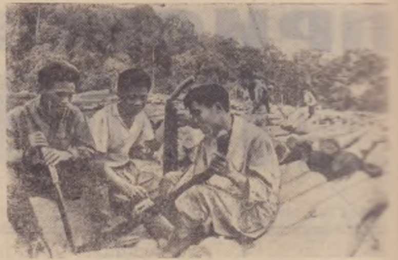
ДЕМОКРАТИЧЕСКАЯ РЕСПУБЛИКА ВЬЕТНАМ. На земляных работах в Туалунге.

секретарь партбюро Поздняковского колхоза.