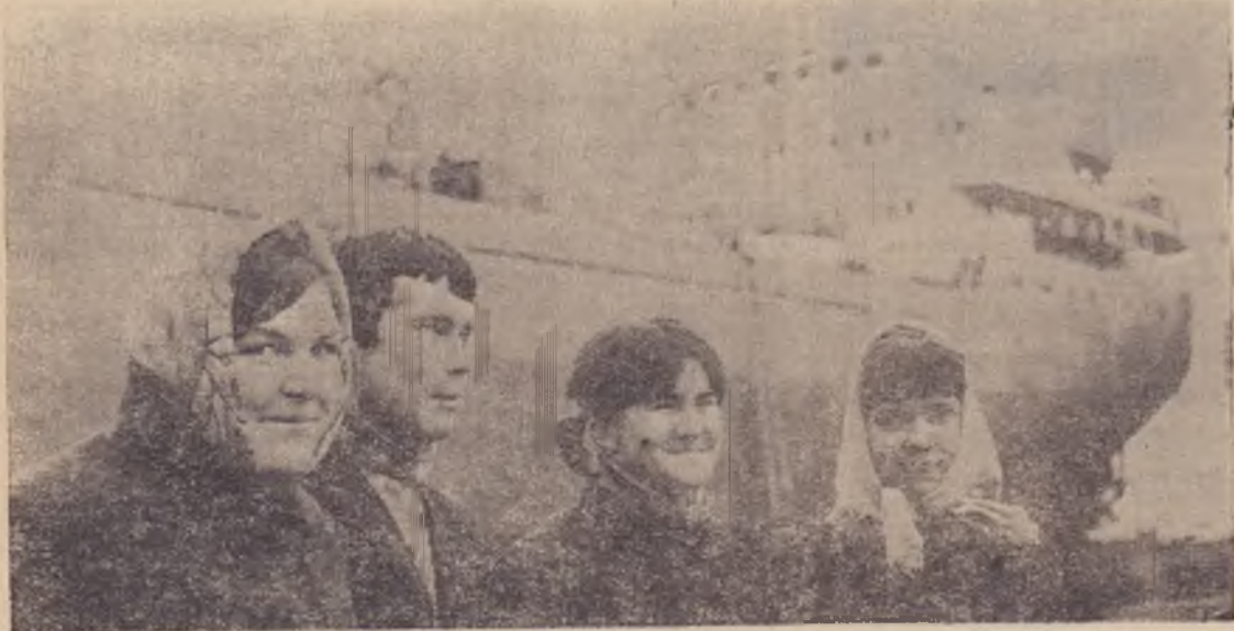
Молодые строители судна.