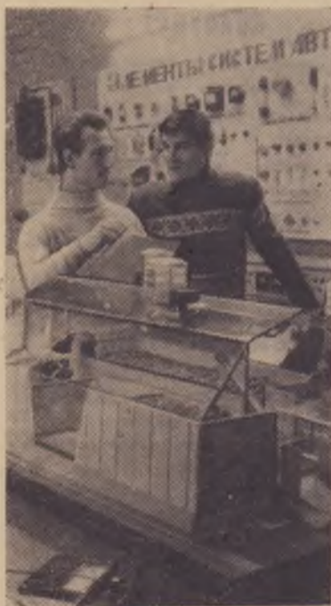
Пермскому сельскохозяйственному институту имени академика Д. Н. Прянишникова