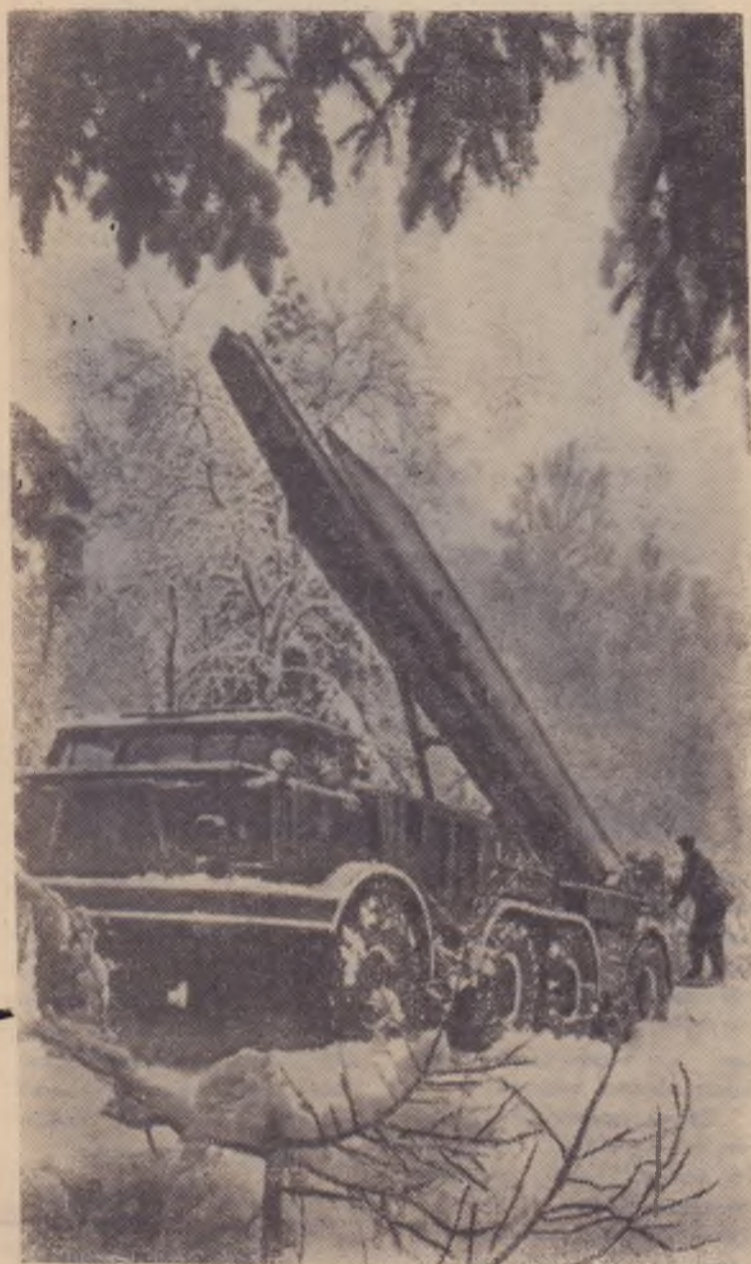
На снимке: ракетная установка готовится к пуску.