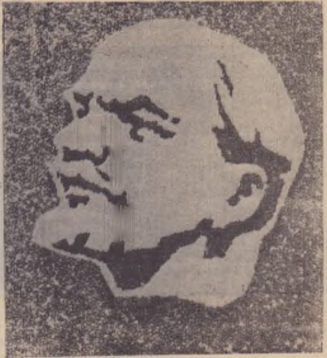
Мозаика из семян риса, гречихи и капусты. Работа Н. А. Набеля.