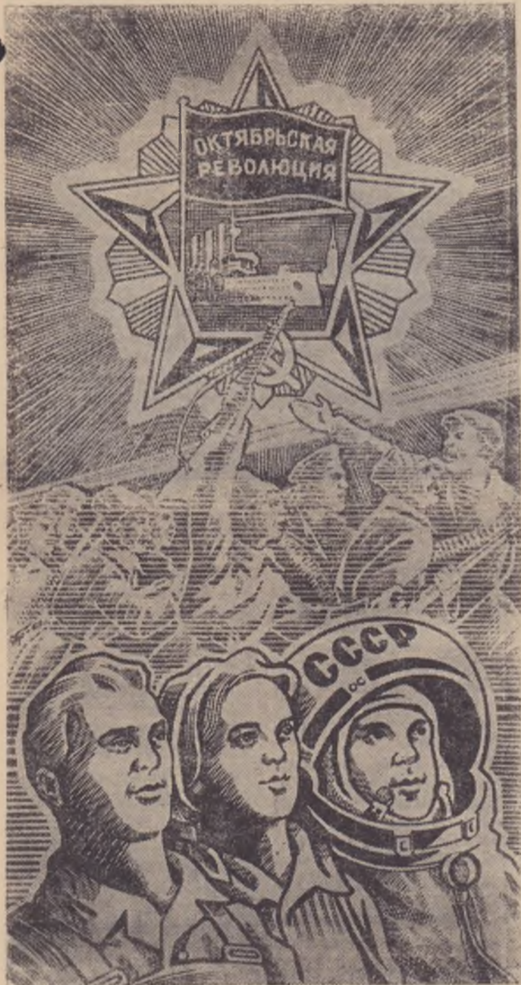
Рисунок художника С. Гринько.