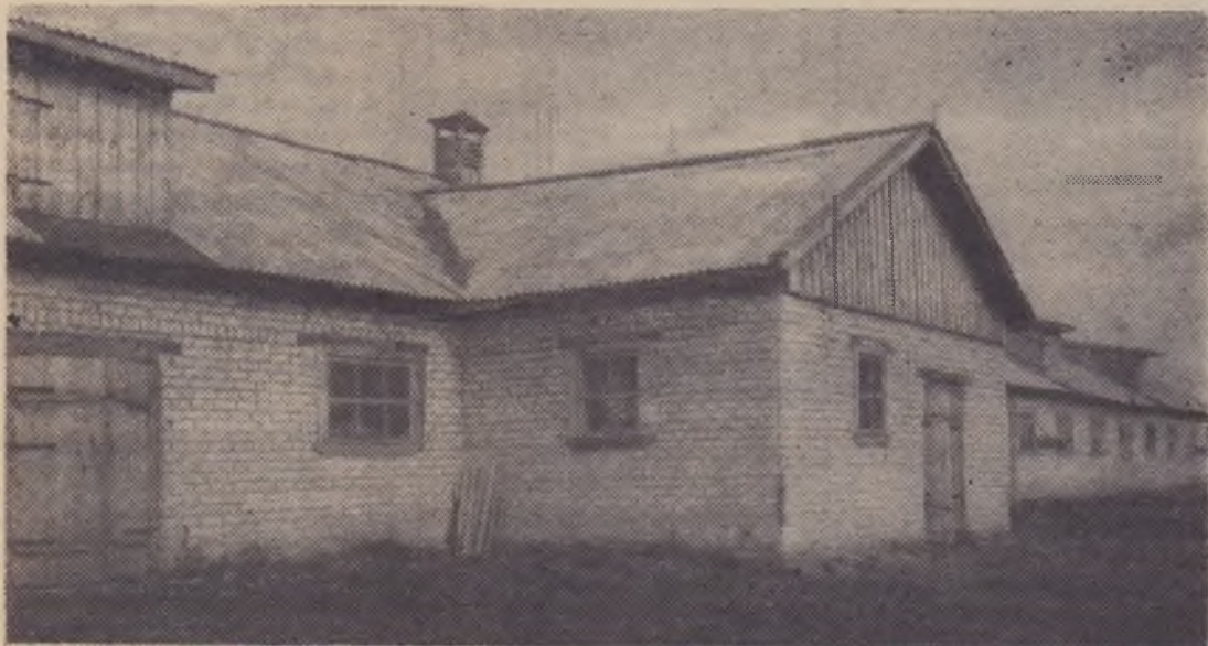
Меняется облик Коробковской молочнотоварной фермы. Вместо старых деревянных животноводческих помеще-

ний строятся современные типовые постройки.