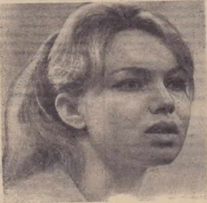
На снимке: Кикоактриса Валентина Теличкина. Она наша землячка—родилась и выросла в селе Красном Арзамасского района.

После выхода на экран фильма «Журналист» я попросил режиссера Сергея Герасимова дать мне интервью только о Валентине Теличкиной. Такая просьба была вызвана успехом Валентины Теличкиной в роли редакционной секретарши: отзывы участников и гостей Московского кинофестиваля, где «Журналист» получил первый приз, были полны самых лестных комплиментов в адрес юной актрисы.