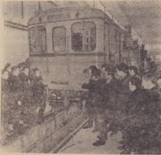
На снимках: будущие машинисты поездов Будапештского метрополитена. Венгерские специалисты успешно ведут строительство первой очереди нового метро. Движение поездов начнется 4 апреля 1970 года в день 25-й годовщины освобождения страны.